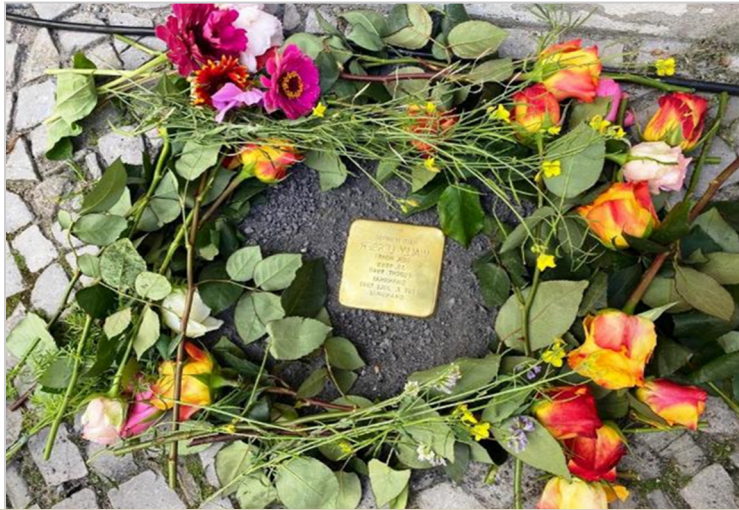
אבני הנגף, לזכרה של האם, ולזכרו של האב ואשתו השנייה