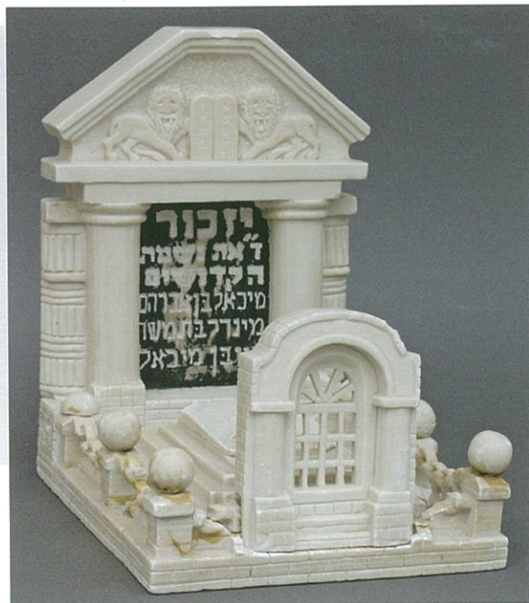
מצבה מיניאטורית מקפריסין

לאחר פינוי מחנות המעצר שבקפריסין יצא לייבנר לשליחות כלכלית בארצות הברית. כעבור שנתיים חזר לטפח את דיר הכבשים בקיבוץ עין השופט ואף שימש גזר הקיבוץ. בשנת 1956 נפטר ממחלה והוא בן 46. בני משפחתו תרמו למוזאון יד ושם יצירות שקיבל יהושע לייבנר במחנות קפריסין כדי לתעד פרק זה בהיסטוריה, וכדי להנציח את דמותו ואת פועלו למען ניצולי השואה.