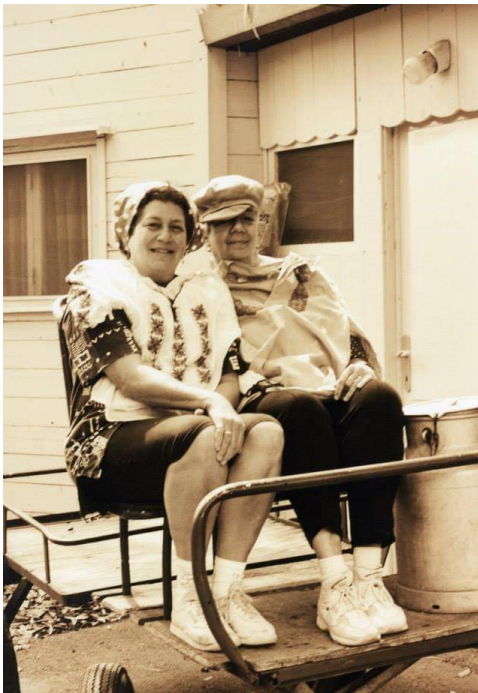
חיה ואידה – חג ה-60 לקיבוץ [1997]